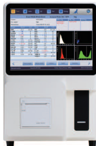
Codice strumento Smart-1