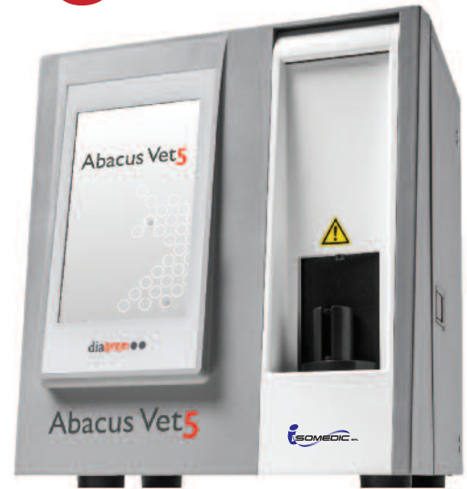
Codice strumento ABACUS

Segnalazioni di risultati patologici, con indicazione automatica di errori di funzione e livello reagenti.