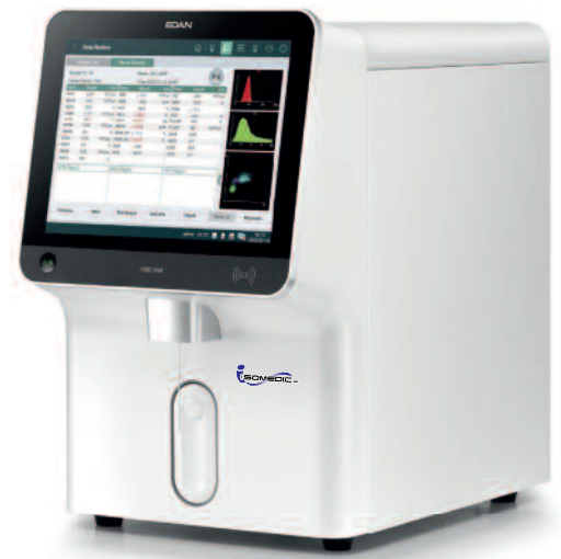
Codice strumento H60 Vet1