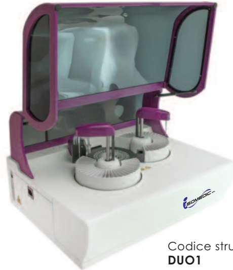
Codice strumento DUO1