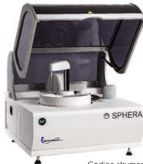
Codice strumento SPHERA1